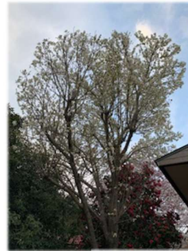
3月の碓原高原邑のさくら達